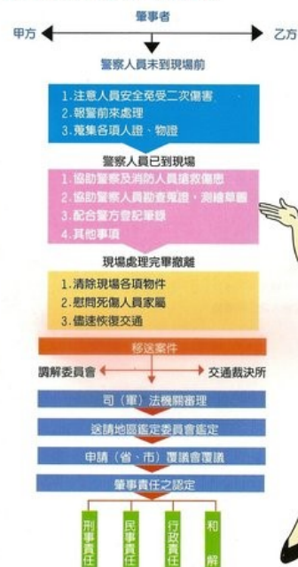
柒、交通事故處理程序概要表